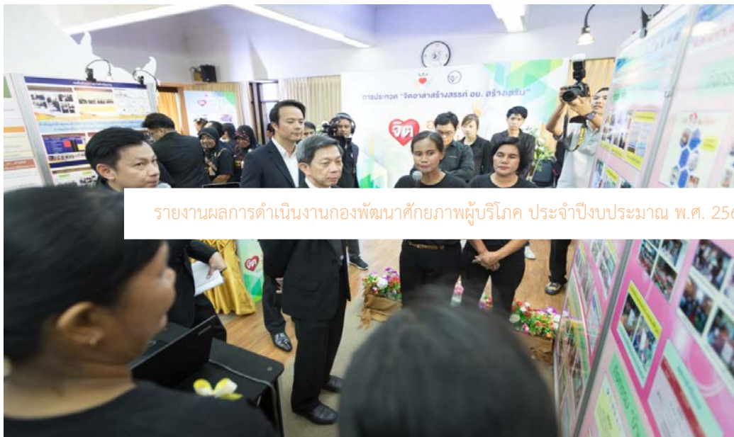
รายงานผลการดำเนินงานกองพัฒนาศักยภาพผู้บริโภค ประจำปีงบประมาณ พ.ศ. 2560