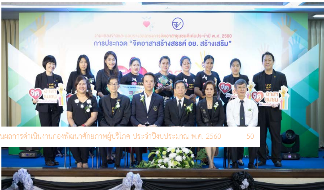
รายงานผลการดำเนินงานกองพัฒนาศักยภาพผู้บริโภค ประจำปีงบประมาณ พ.ศ. 2560