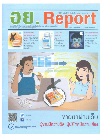
อย. Report ฉบับที่ ๘๐ ประจำเดือนพฤษภาคม ๒๕๕๙