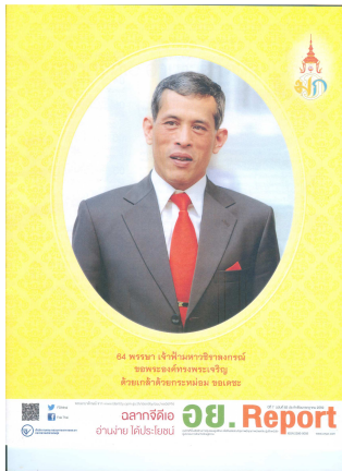
อย. Report ฉบับที่ ๘๒ ประจำเดือนกรกฎาคม ๒๕๕๙