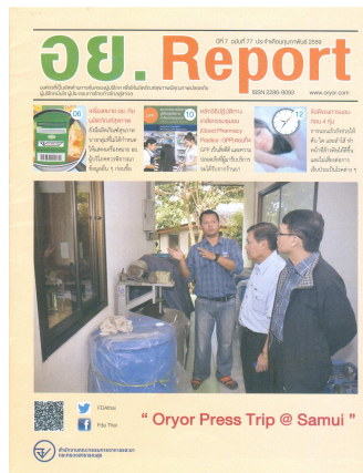
อย. Report ฉบับที่ ๗๗ ประจำเดือนกุมภาพันธ์ ๒๕๕๙