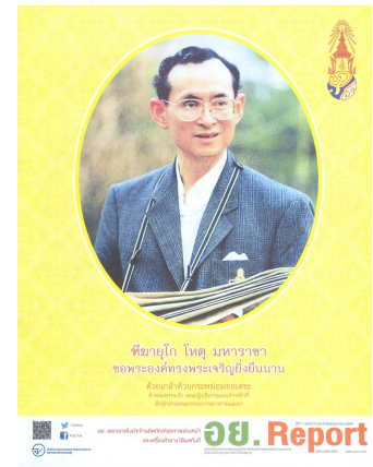
อย. Report ฉบับที่ ๗๕ ประจำเดือนธันวาคม ๒๕๕๘