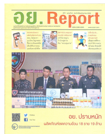
อย. Report ฉบับที่ ๘๑ ประจำเดือนมิถุนายน ๒๕๕๙