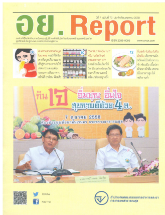
อย. Report ฉบับที่ ๗๓ ประจำเดือนตุลาคม ๒๕๕๘