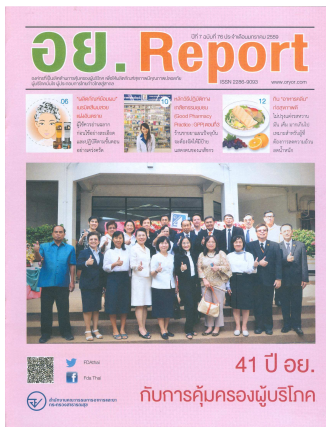
อย. Report ฉบับที่ ๗๖ ประจำเดือนมกราคม ๒๕๕๙