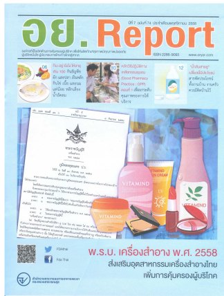
อย. Report ฉบับที่ ๗๔ ประจำเดือนพฤศจิกายน ๒๕๕๘