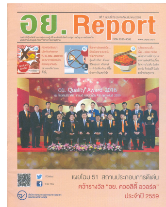
อย. Report ฉบับที่ ๗๘ ประจำเดือนมีนาคม ๒๕๕๙