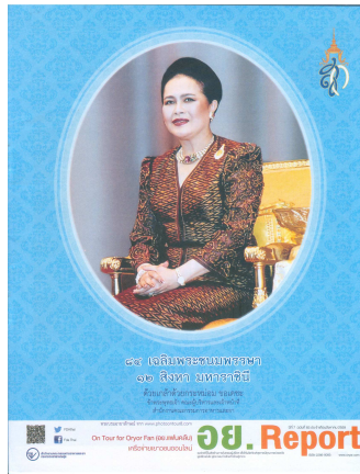
อย. Report ฉบับที่ ๘๓ ประจำเดือนสิงหาคม ๒๕๕๙