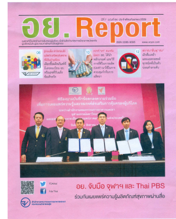
อย. Report ฉบับที่ ๘๔ ประจำเดือนกันยายน ๒๕๕๙