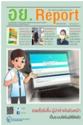
อย.Report ฉบับที่ ๗๐ ประจำเดือนกรกฎาคม ๒๕๕๘