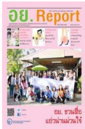
อย. Report ฉบับที่ ๖๕ ประจำเดือนกุมภาพันธ์ ๒๕๕๘