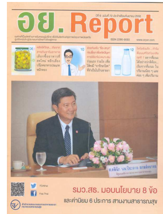
อย.Report ฉบับที่ ๗๒ ประจำเดือนกันยายน ๒๕๕๘