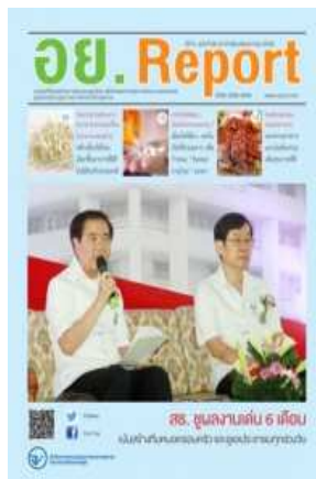
อย. Report ฉบับที่ ๖๘ ประจำเดือนพฤษภาคม ๒๕๕๘