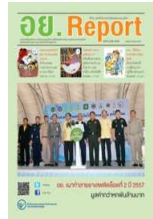
อย. Report ฉบับที่ ๖๓ ประจำเดือนธันวาคม ๒๕๕๗