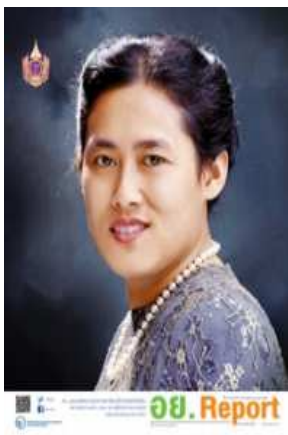
อย. Report ฉบับที่ ๖๗ ประจำเดือนเมษายน ๒๕๕๘