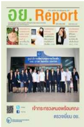
อย. Report ฉบับที่ ๖๑ ประจำเดือนตุลาคม ๒๕๕๗