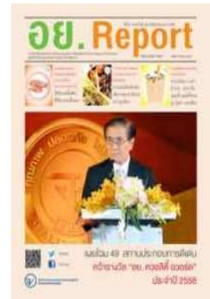
อย. Report ฉบับที่ ๖๖ ประจำเดือนมีนาคม ๒๕๕๘