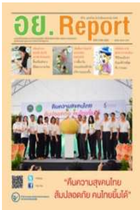
อย. Report ฉบับที่ ๖๔ ประจำเดือนมกราคม ๒๕๕๘