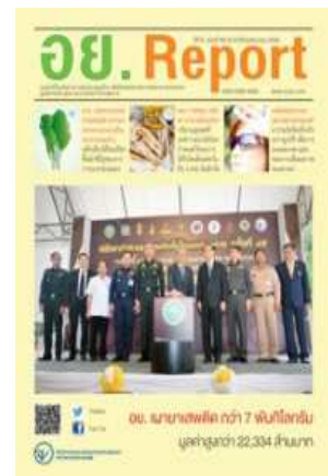
อย. Report ฉบับที่ ๖๙ ประจำเดือนมิถุนายน ๒๕๕๘