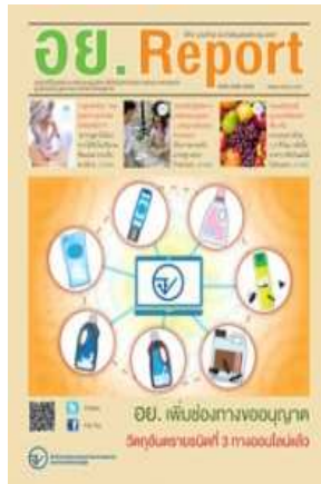
อย. Report ฉบับที่ ๖๒ ประจำเดือนพฤศจิกายน ๒๕๕๗