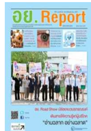
อย. Report ฉบับที่ ๕๔ ประจำเดือนมีนาคม ๒๕๕๗