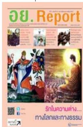
อย. Report ฉบับที่ ๕๓ ประจำเดือนกุมภาพันธ์ ๒๕๕๗