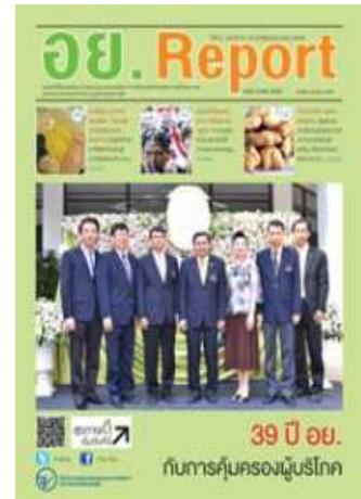
อย. Report ฉบับที่ ๕๑ ประจำเดือนธันวาคม ๒๕๕๖