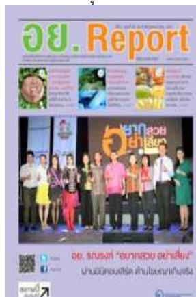
อย. Report ฉบับที่ ๕๖ ประจำเดือนพฤษภาคม ๒๕๕๗