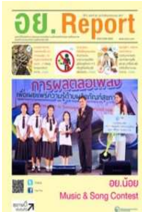
ออย.Report ฉบับที่ ๕๘ ประจำเดือนกรกฎาคม ๒๕๕๗