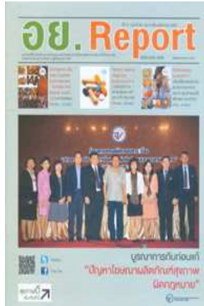
ออย.Report ฉบับที่ ๕๙ ประจำเดือนสิงหาคม ๒๕๕๗