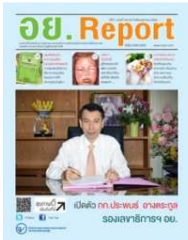
อย. Report ฉบับที่ ๔๙ ประจำเดือนตุลาคม ๒๕๕๖