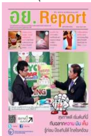
อย. Report ฉบับที่ ๕๒ ประจำเดือนมกราคม ๒๕๕๗