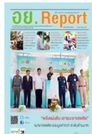
อย. Report ฉบับที่ ๕๗ ประจำเดือนมิถุนายน ๒๕๕๗