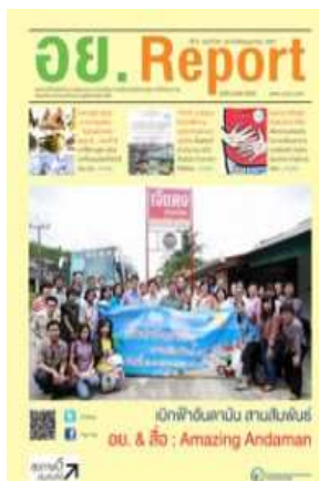
อย. Report ฉบับที่ ๕๕ ประจำเดือนเมษายน ๒๕๕๗