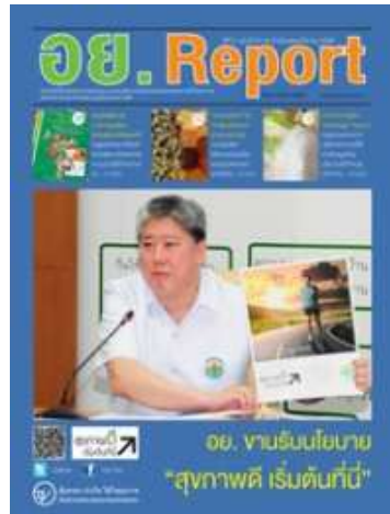
อย. Report ฉบับที่ ๕๐ ประจำเดือนพฤศจิกายน ๒๕๕๖